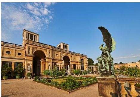
Orangerie Schloß Sanssouci

Sie starten in einer meiner Lieblingsstädte, in Potsdam. Hier gibt es viel zu entdecken, nicht nur Gartenkultur. Potsdam verbindet Gartenkenner mit 2 Namen, Peter Josef Lenné und Karl Foerster. Der Garten Foerster im Stadtteil Bornim, zeigt Ihnen den Senkgarten und das denkmal-geschützte Wohnhaus. Das 5.000 m 2 große Areal ist authentisch und wird auch 50 Jahre nach dem Tod des bekannten Staudenzüchters noch liebevoll erhalten. Das Kontrastprogramm sind die Gartenanlagen von Schloss Babelsberg, der Pfaueninsel, dem Neuen Garten und natürlich Schloss Sanssouci. Potsdam ist ein extrem schönes Städtchen, nicht umsonst ziehen viele Berliner nach Potsdam in die grüne Idylle. Günther Jauch hat mit dem Sternekoch Tim Raue in einer alten Villa am See ein tolles Restaurant eröffnet. Hier gibt es u. a. bodenständige Gerichte wie Königsberger Klopse und das mit Seeblick. Und bitte nicht weitersagen: Zwischen Potsdam und Berlin liegt die Villa Liebermann am Wannensee. Der Garten wurde nach alten Plänen wieder neu angelegt. Man kann im Haus viele Kunstwerke Liebermanns betrachten und auf der Terrasse gibt es kleine Snacks und Getränke. Für mich einer der schönsten Plätze, die ich in Deutschland kenne!