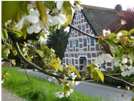
Fachwerkhaus im Alten Land

Durch das Alte Land fahren Sie nach Wischhafen und mit der Elbfähre nach Glückstadt. Von dort geht es weiter nach Bismarck. St. Peter Ording ist um die Ecke, aber dort ist es zu rummelig und auch teurer. Die nächste Etappe ist dann Husum. Die Fahrtzeit an diesem Tag beträgt ca. 2 ½ Stunden. Hier empfehlen wir nochmal 3 Nächte, denn Sie können von hier aus neben dem Museum von Theodor Storm auch einen Ausflug zur Halbinsel Nordstrand unternehmen und Klein-Holland (Friedrichstadt) besuchen. So hätten Sie Zeit genug für alles!